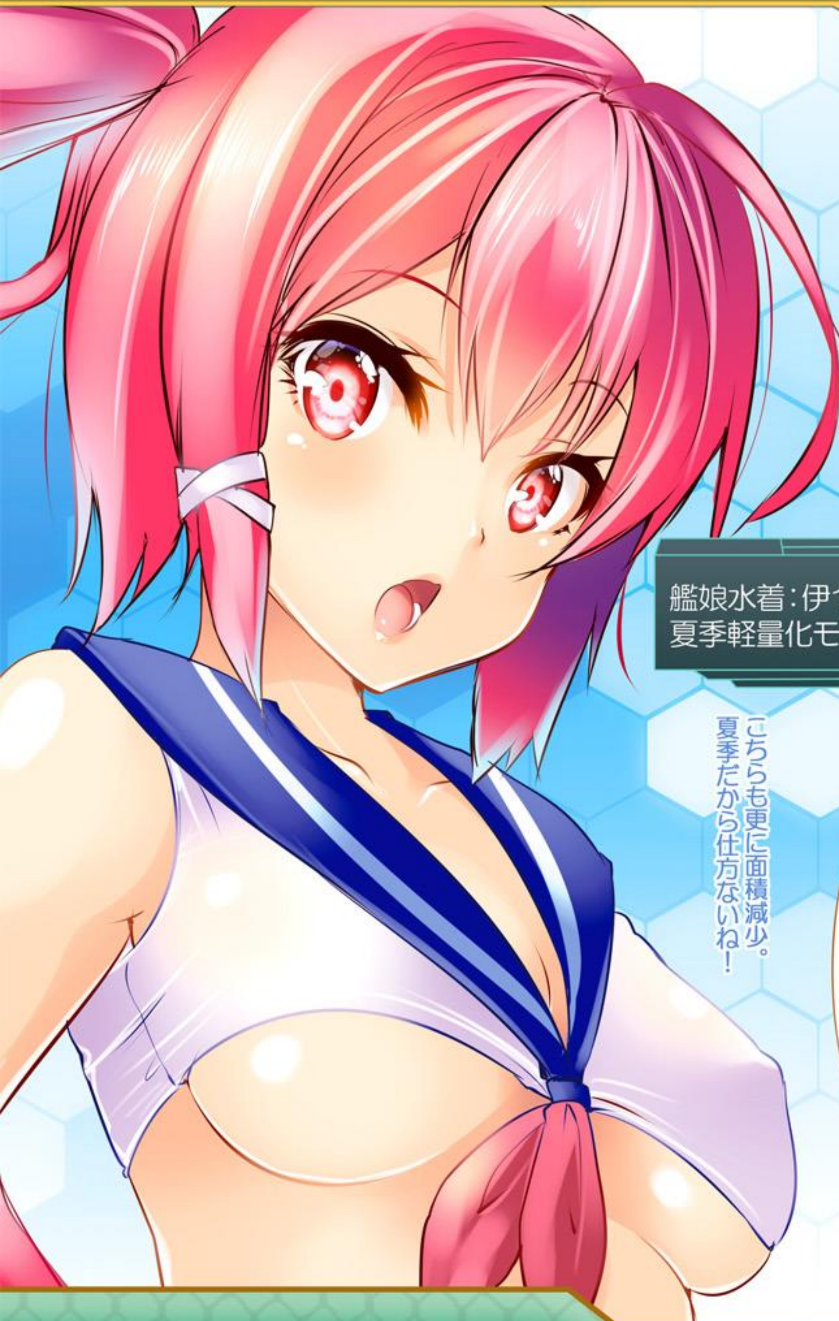
艦娘水着：伊168仕様 夏季軽量化モデル