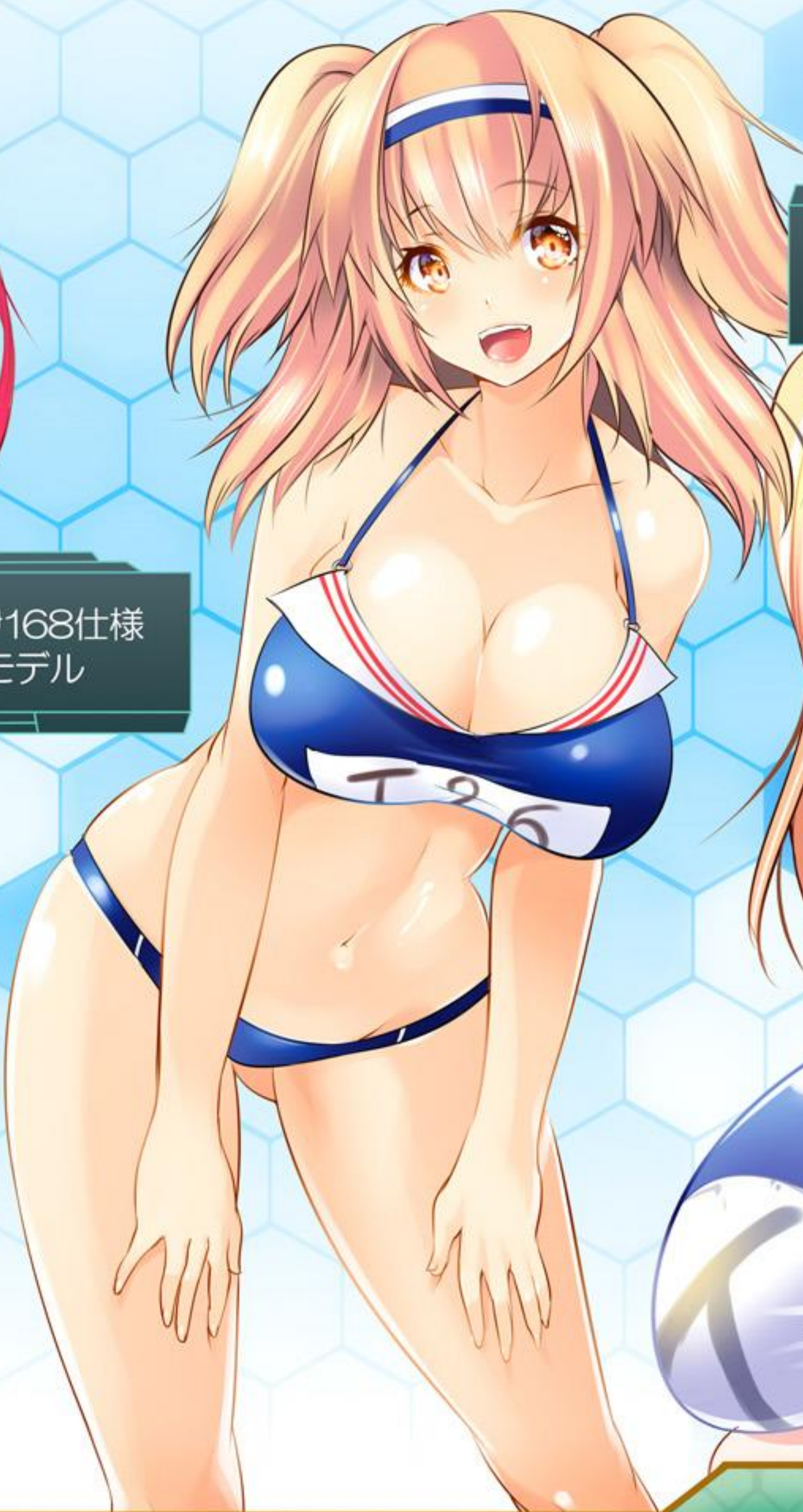
艦娘水着：伊26モデル & デフォルトモデル