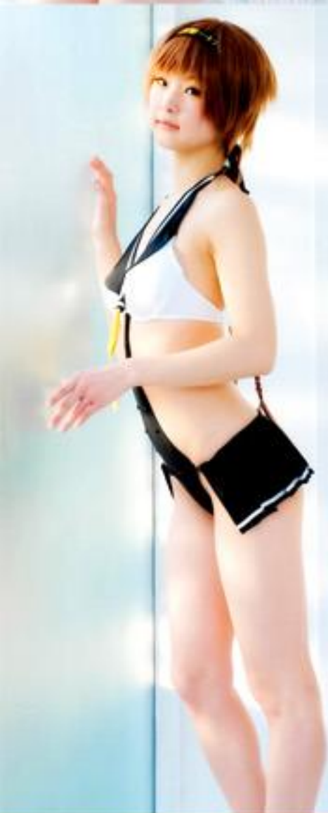
イラスト:MAKI 衣装制作:トム(@kssnpi) モデル:有澤里香(@Arisawa_Rika)