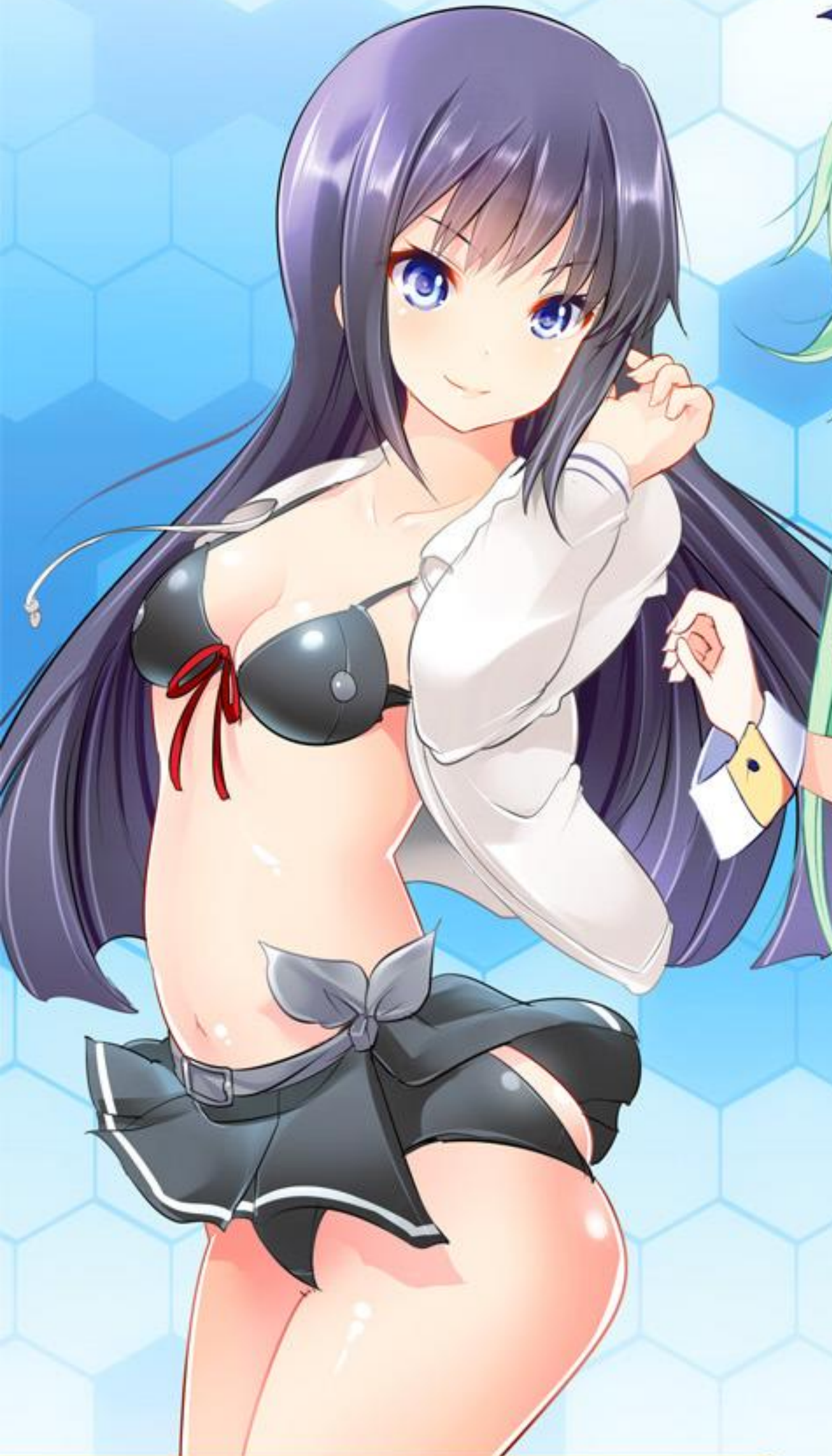
艦娘水着：白露型モデル 山風仕様

オーソドックスに、元デザインを踏襲した ビキニ+パレオ+パーカーの三点セット。 これならリアルにも着られそう。