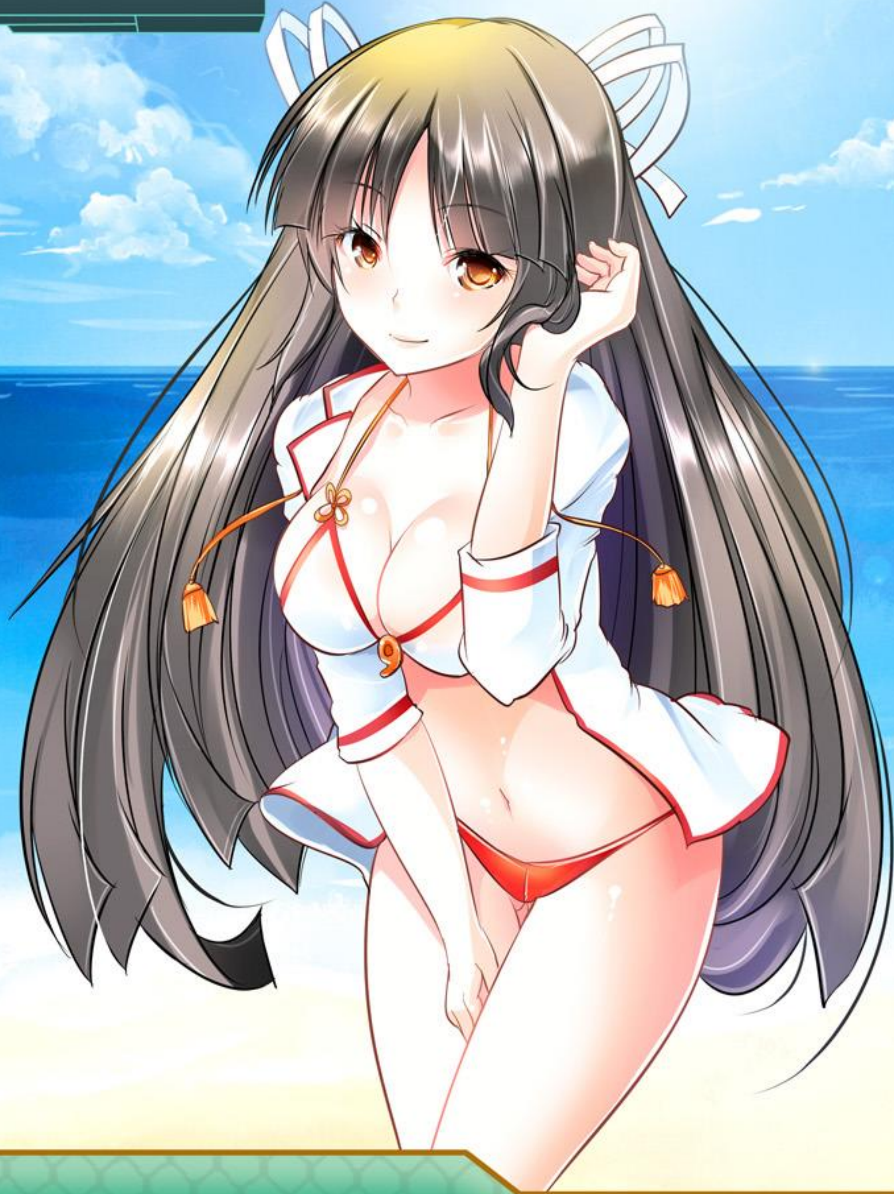
艦娘水着：大鷹モデル

シンプルなスポーツタイプに 甲板をデザインしたパレオのセットです。 シンプルなゆえに、ある意味着る人を選びそうです。