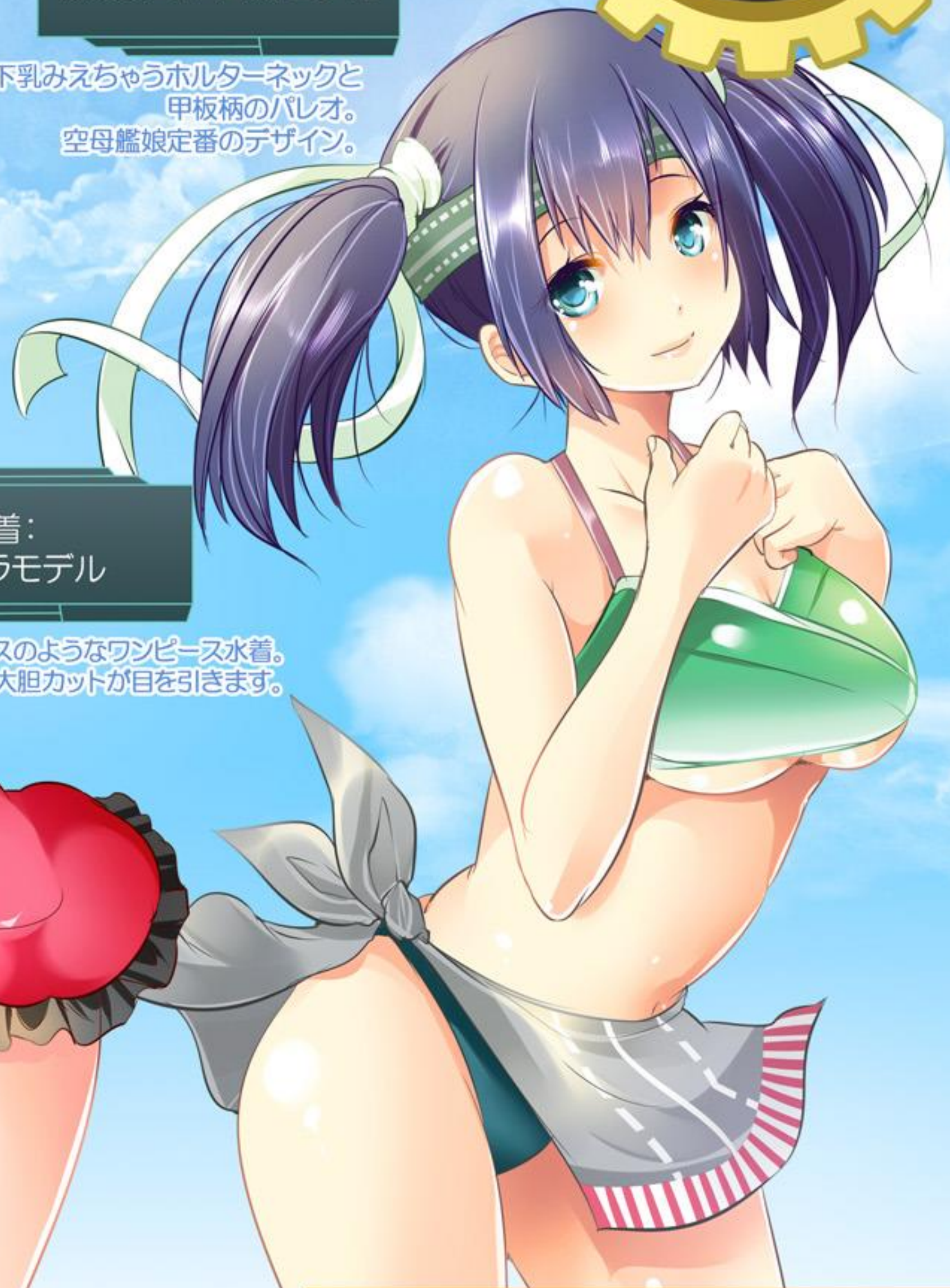
艦娘水着： アキラモデル