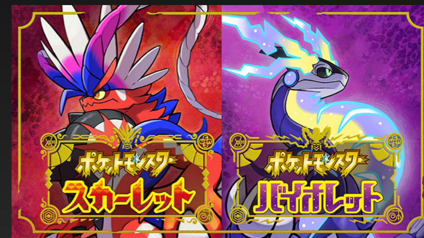
C. ポケットモンスター スカーレット・バイオレット Pokémon Scarlet and Violet