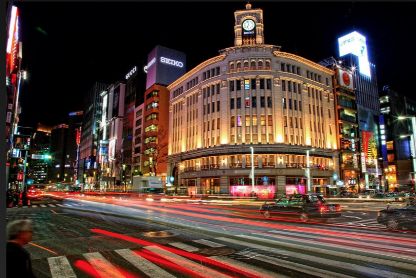
ちゅうおうく B. 東京都中央区 (銀座があるところ)