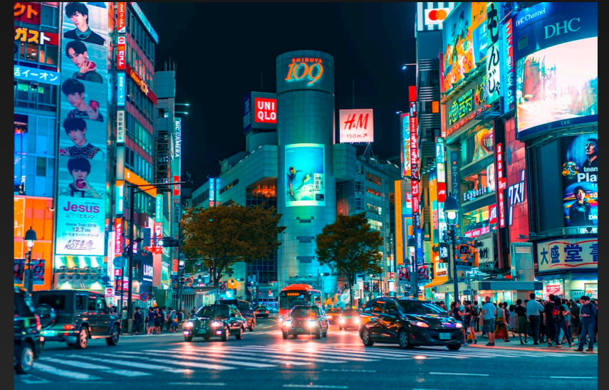
C. 東京都渋谷区 (渋谷があるところ)