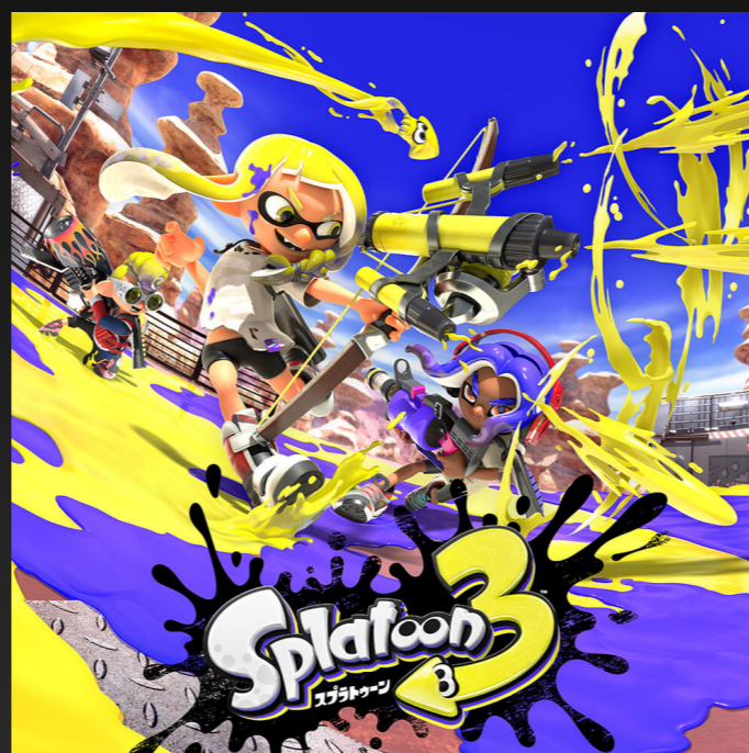
B. スプラトゥーン3 Splatoon3