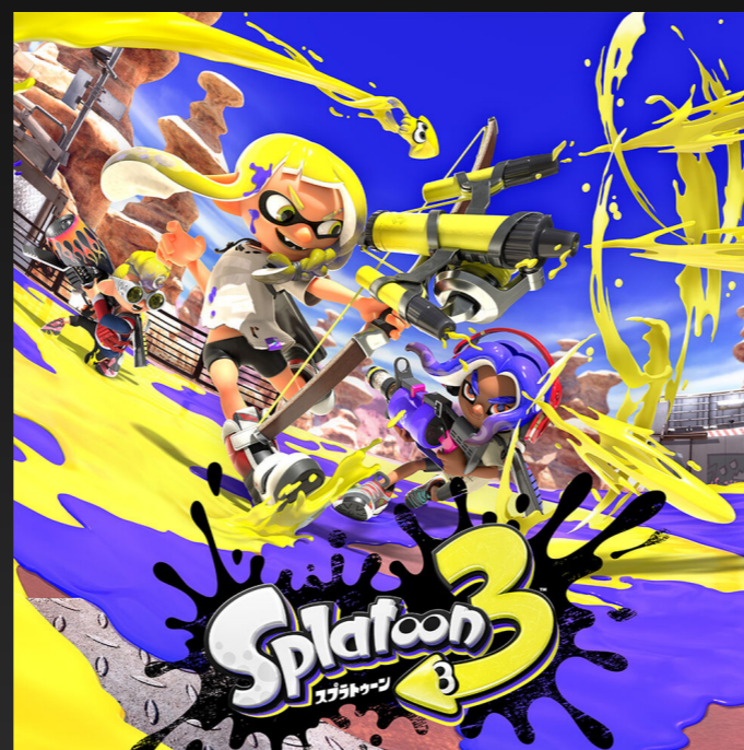
B. スプラトゥーン3 Splatoon3