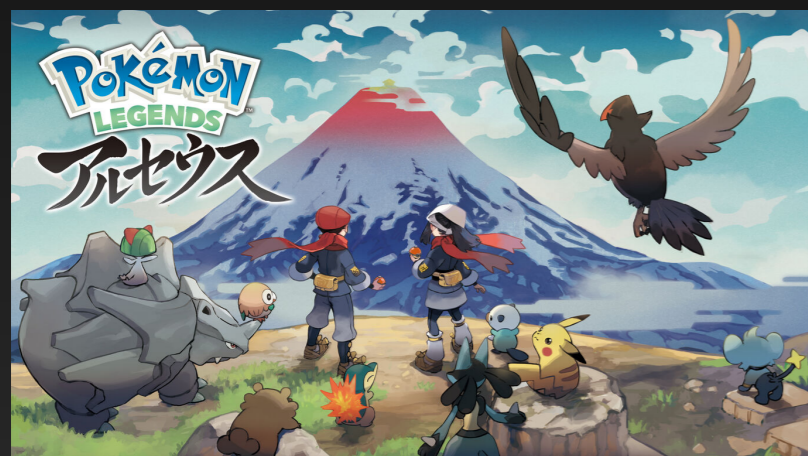
A. Pokemon LEGENDS アルセウス Pokemon Legends: Arceus

What is the best-selling game in Japan, 2022?