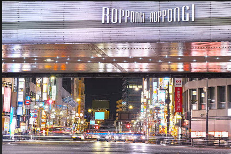
A. 東京都港区 (六本木があるところ)