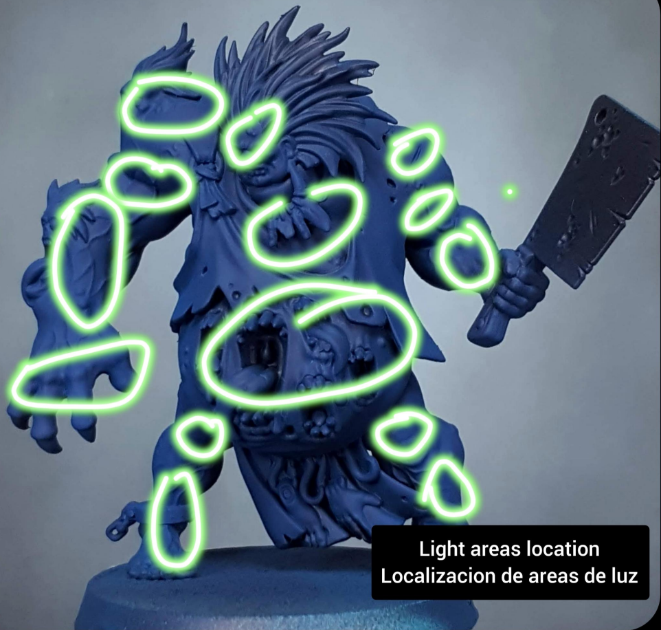
Light areas location Localizacion de areas de luz