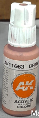
Main skin tones