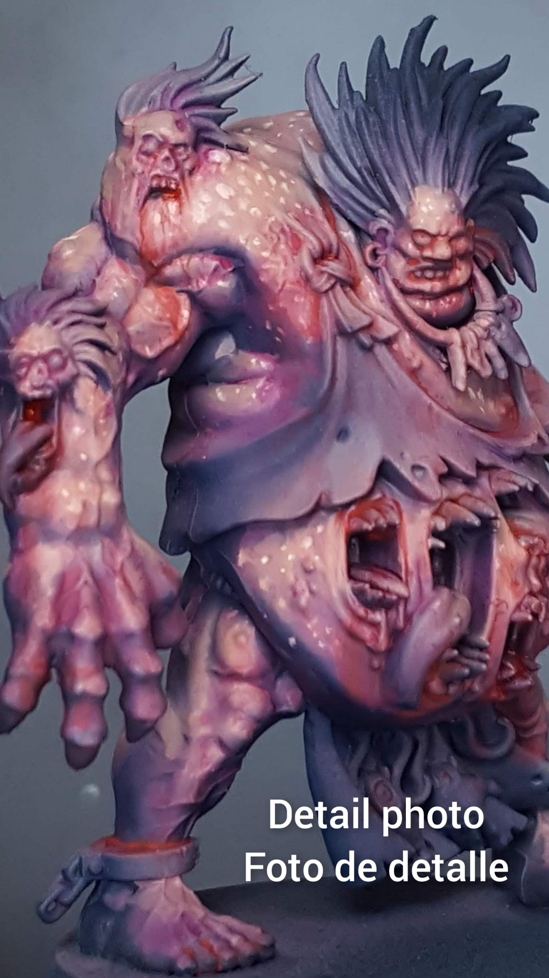
Detail photo Foto de detalle