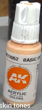
Tonos principales de piel

This way to do the skin involves: check light reflection over the black primer, regular paint applied with airbrush, some details by brush and the oilwashes.