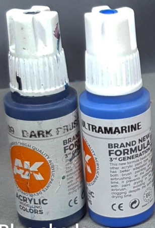
Blue shadows Sombras azules