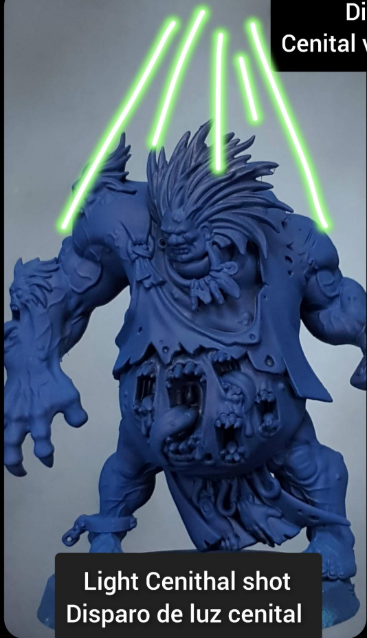
Light Cenital shot Disparo de luz cenital