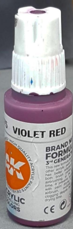
Violet midtone Tono medio violeta