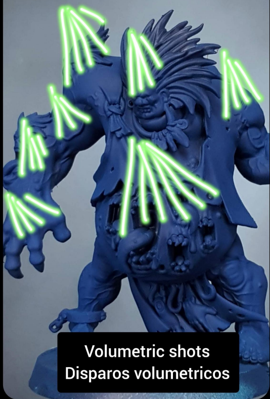
Volumetric shots Disparos volumetricos