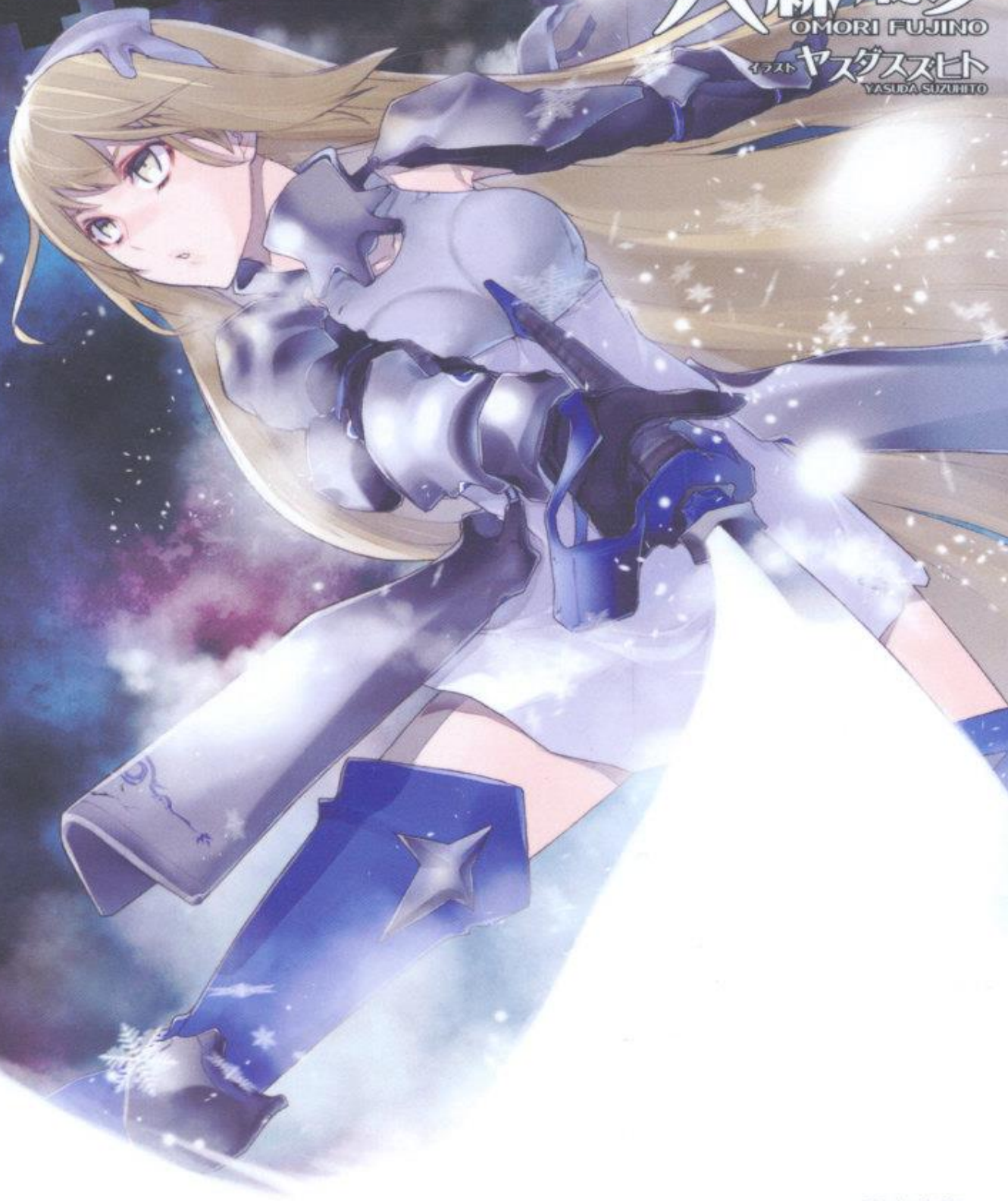
イラスト ヤスダスズヒト YASUDA SUZUHITO