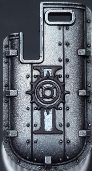
Black and white inner part Negro y blanco en centro

Pinto todas las partes doradas de negro para aislarlas. Y con Nuln Oil wash, lavo los huecos del escudo y también los tornillos (cuidadosamente)