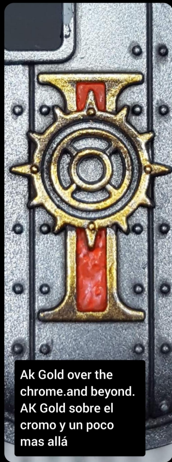
Ak Gold over the chrome.and beyond. AK Gold sobre el cromo y un poco mas allá