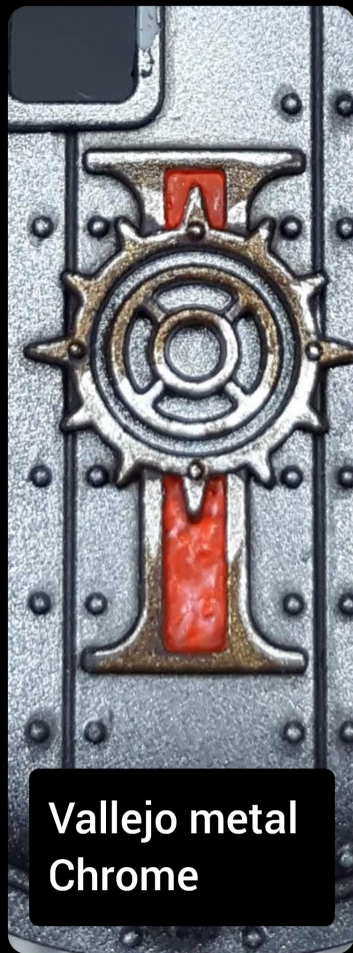
Vallejo metal Chrome