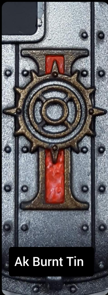
Ak Burnt Tin