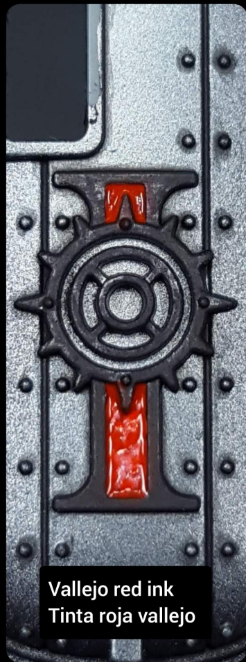
Vallejo red ink Tinta roja vallejo