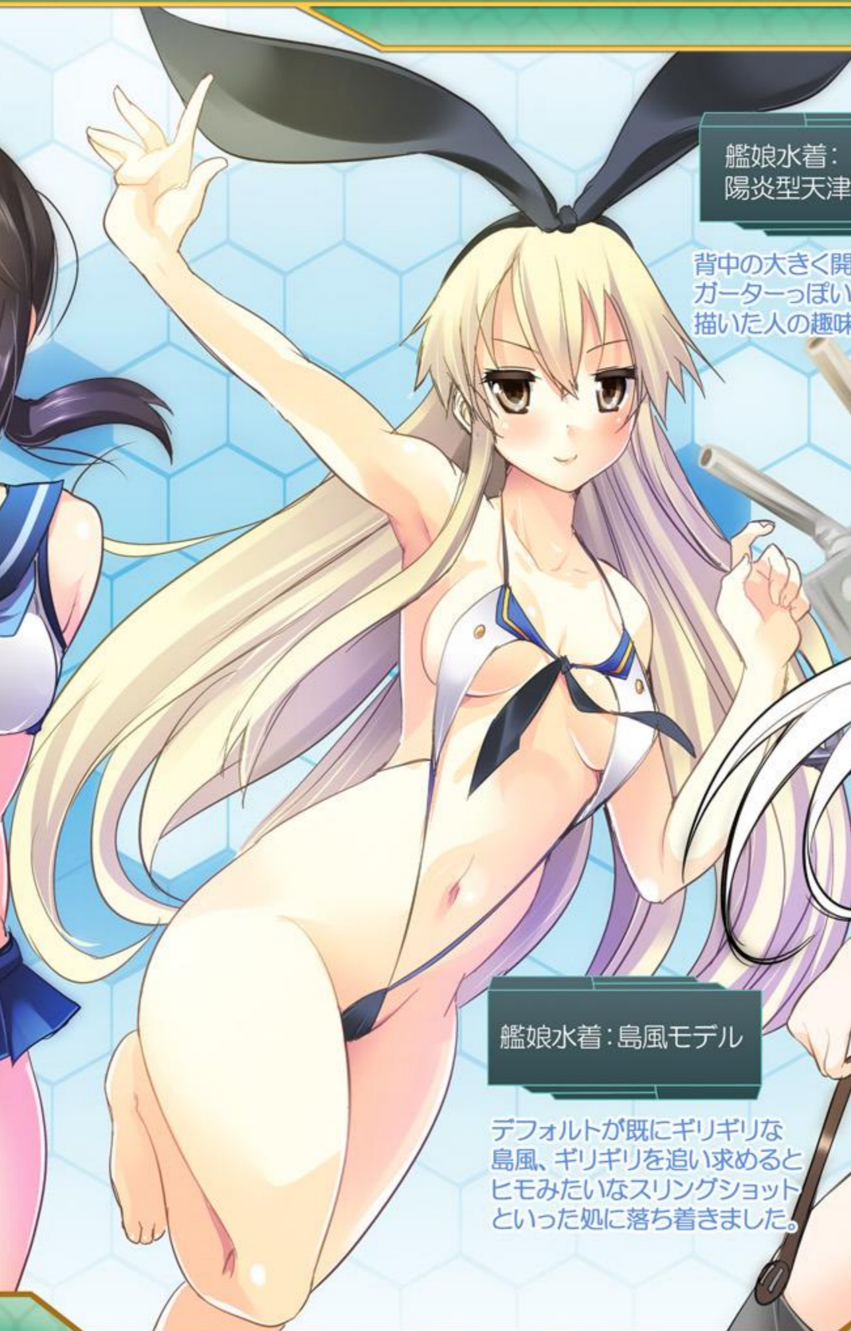
艦娘水着：島風モデル

背中が大きく開いたワンピース。 ガーターっぽいベルト部分は 描いた人の趣味です。