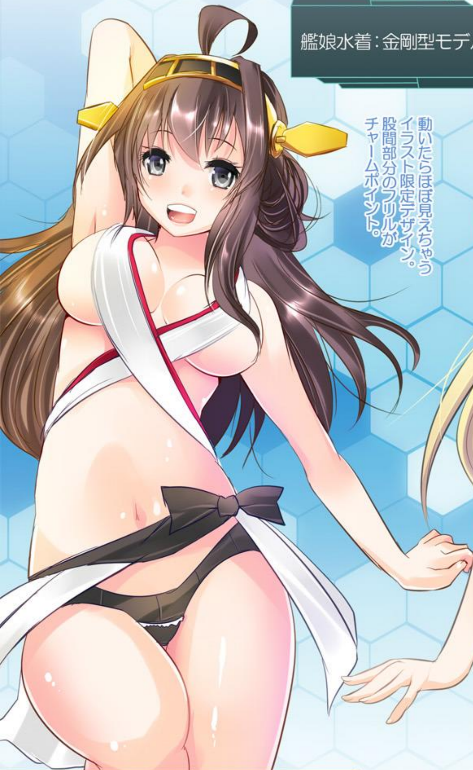
艦娘水着：金剛型モデル

動いたりはほぼ見えちゃう イラスト限定デザイン。 股間部分のフリルが チャームポイント。