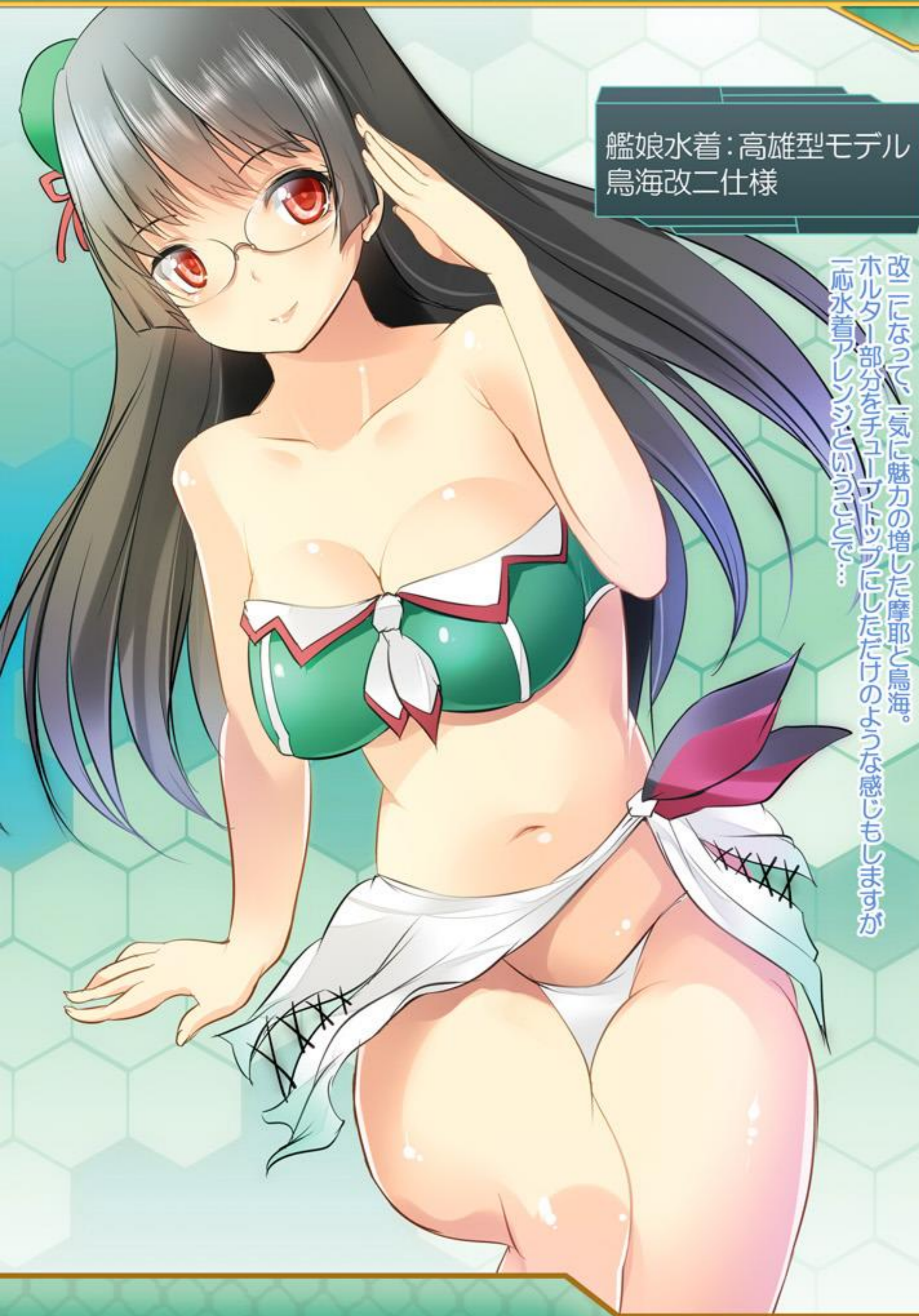
艦娘水着：高雄型モデル 鳥海改二仕様