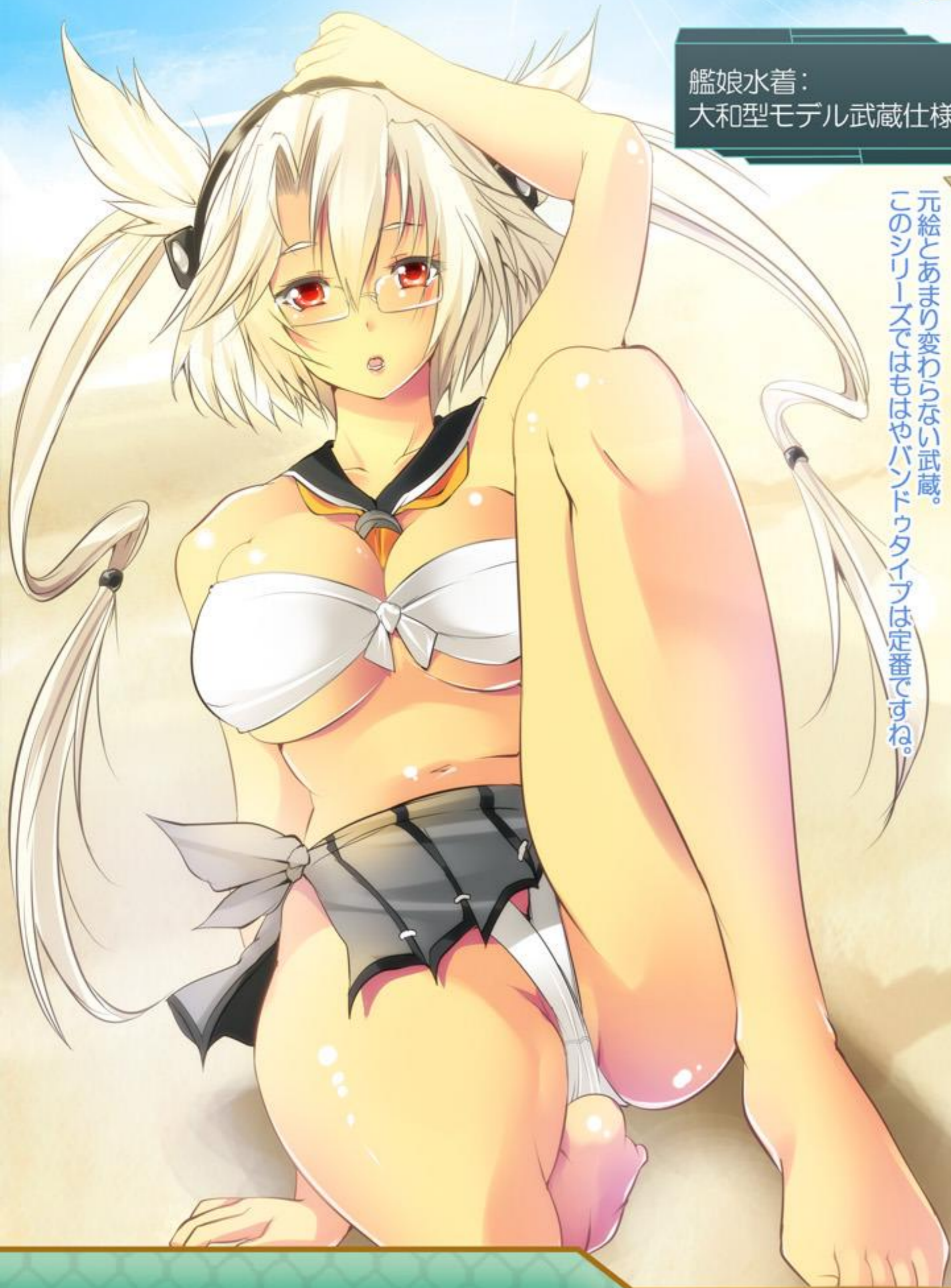
艦娘水着： 大和型モデル武蔵仕様

元絵とあまり変わらない武蔵。 このシリーズではもはやバンドウタイプは定番ですね。