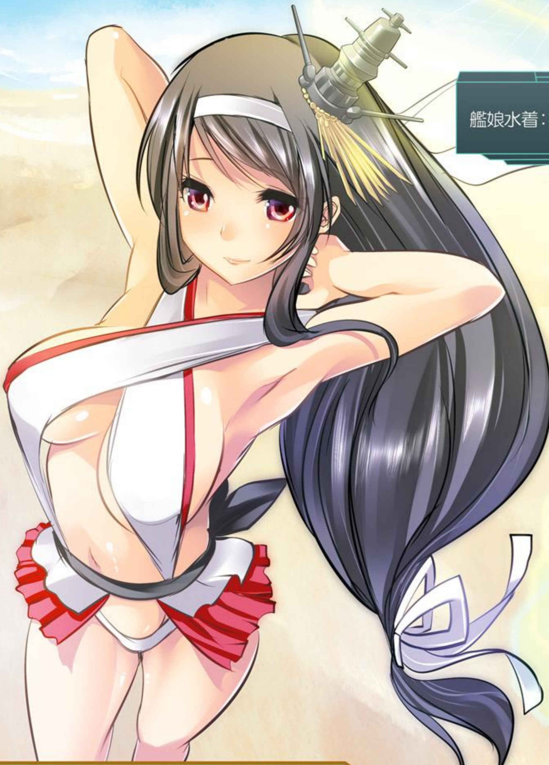
艦娘水着：扶桑型モデル

スリングショット土層のパレオで元絵を踏襲。 これならギリギリリアルでも……ないか。