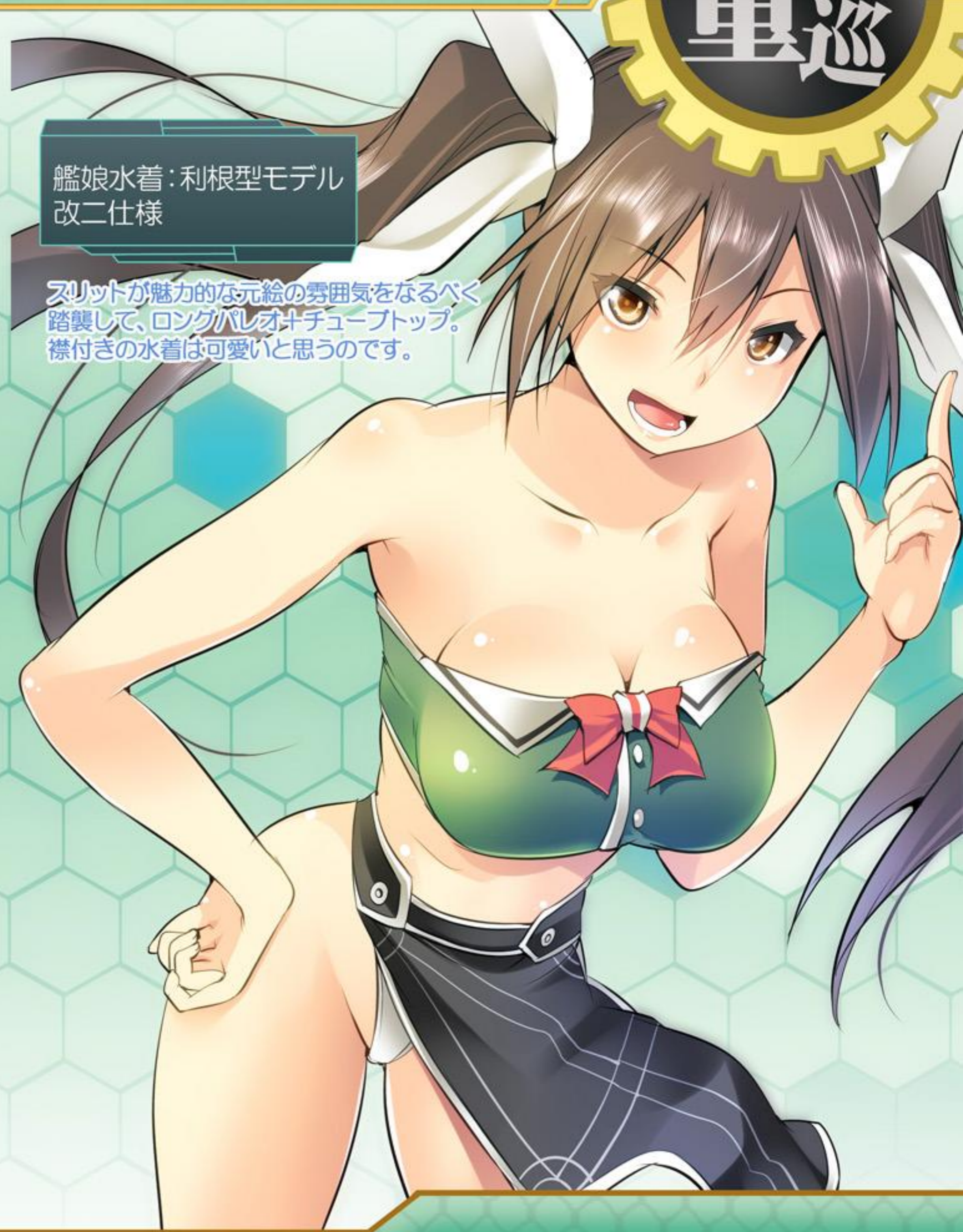
艦娘水着：利根型モデル 改二仕様