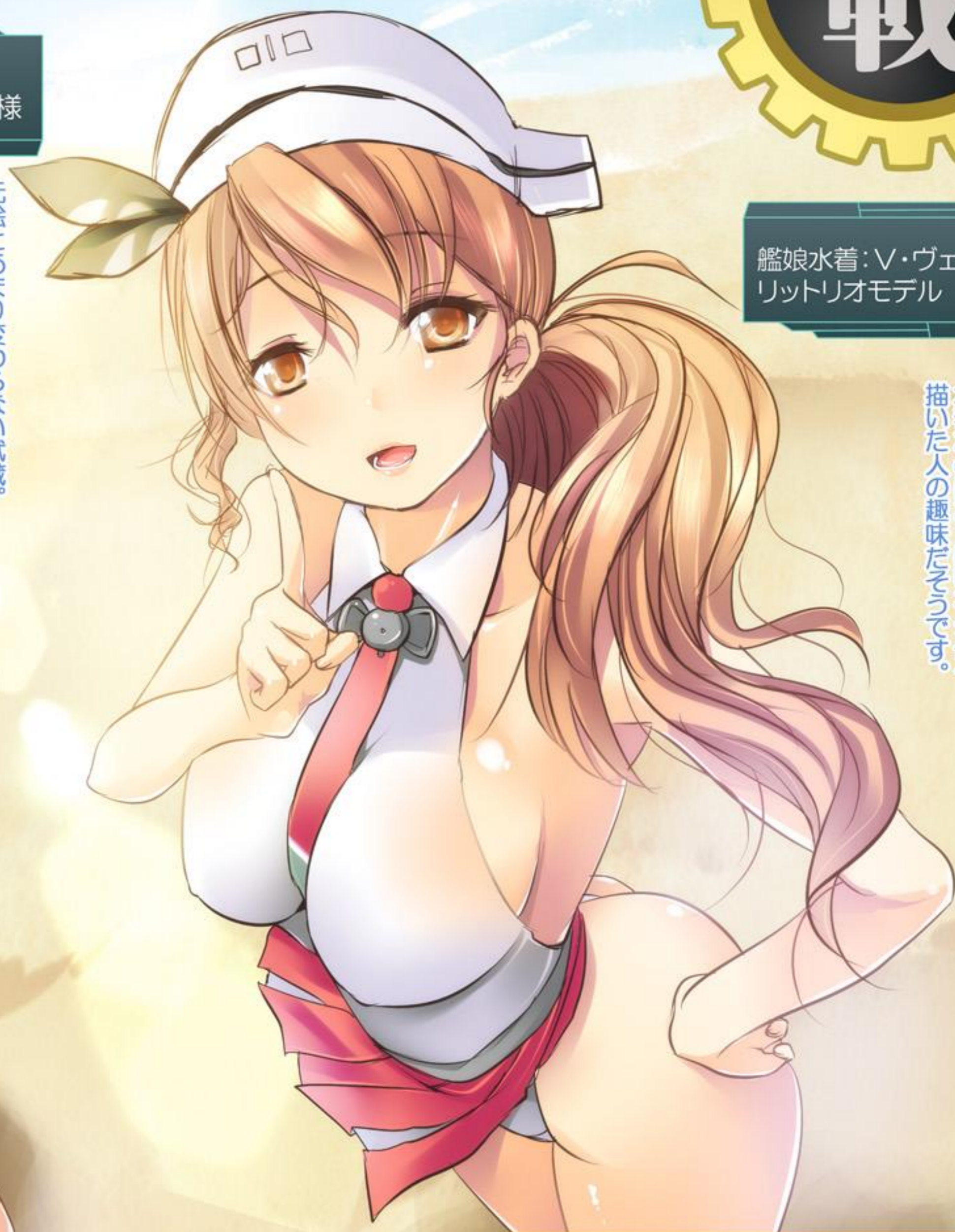
艦娘水着：V・ヴェネト級 リットリオモデル

このシリーズでは珍しい、ワンピース(襟付き)＋パレオ。 水着なのにおっぱいネクタイ。 描いた人の趣味だそうです。